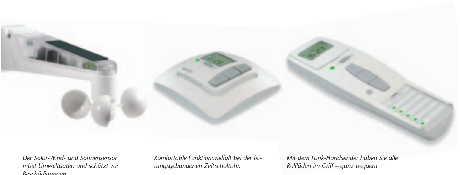
Der Solar-Wind- und Sonnensensor misst Umweltdaten und schützt vor Beschädigungen.