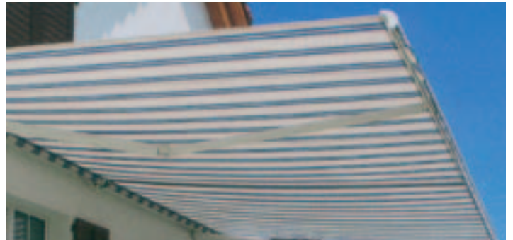
Bei Böen oder aufziehendem Unwetter wird die Markise sofort eingezogen – automatisch.