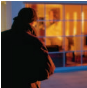
Dank der intronic-Anwesenheitssimulation wirkt Ihr Haus immer bewohnt. Das schreckt Einbrecher ab.