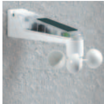
Der Solar-Wind- und Sonnensensor misst Umweltdaten und schützt vor Beschädigungen.